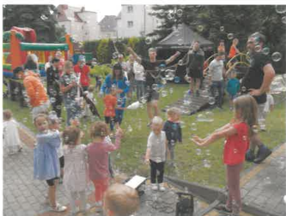
Dzień Mamy Taty – Festyn Rodzinny