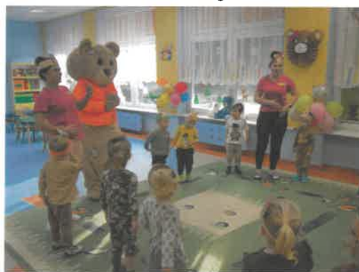
Dzień Pluszowego Misia