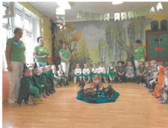
Dzień Patrona i Dzień Ziemi