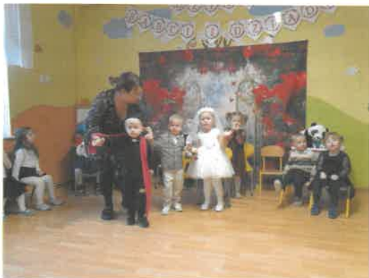
Dzień Babci i Dziadka