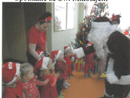
Spotkanie ze Św. Mikołajem