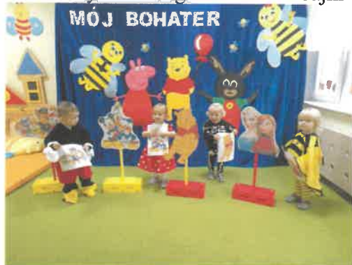
Bal wymarzonego bohatera z bajki