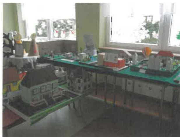
„Bezpieczna droga do żłobka”