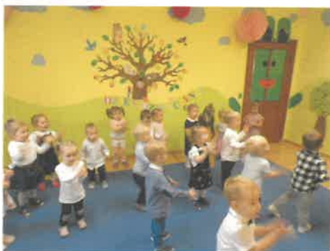
Dzień Dziewczynki Światowy