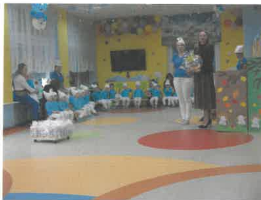
Pasowanie na Żłobkowicza